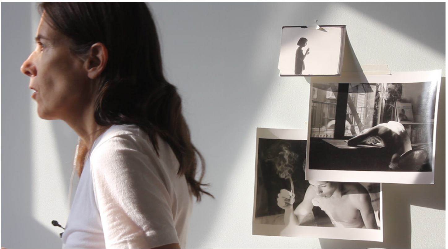
Moyra Davey, Hemlock Forest (production still), 2016

BNLMTL 2016 est une réalisation de La Biennale de Montréal en coproduction avec le Musée d'art contemporain de Montréal, et avec la participation de 14 autres partenaires locaux.